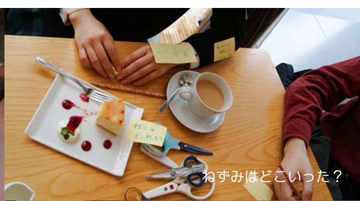
ねずみはどこいった?